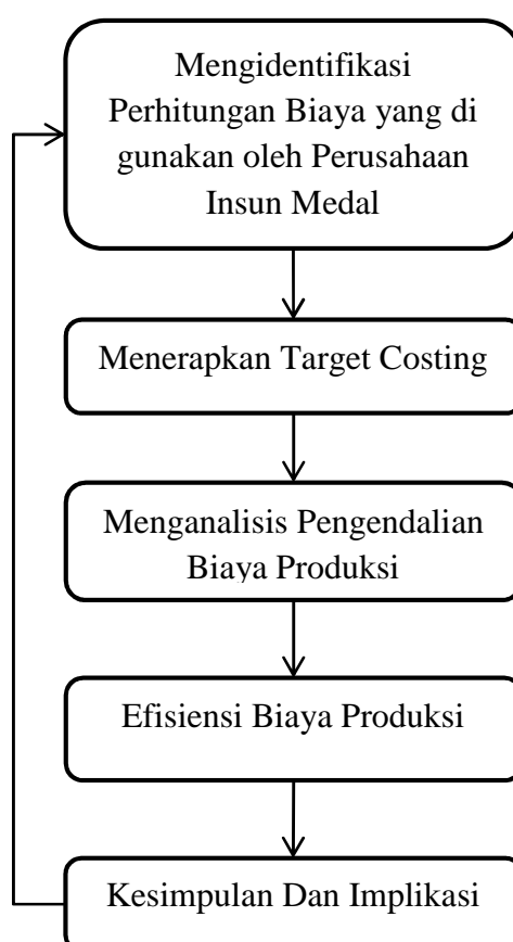
Gambar 2. 1 Kerangka Pemikiran

Berdasarkan uraian di atas, gambaran menyeluruh penelitian ini yang mengangkat penelitian mengenai penerapan metode target costing dalam upaya pengendalian biaya produksi. Berikut merupakan gambaran kerangka pemikiran dari penelitian ini: